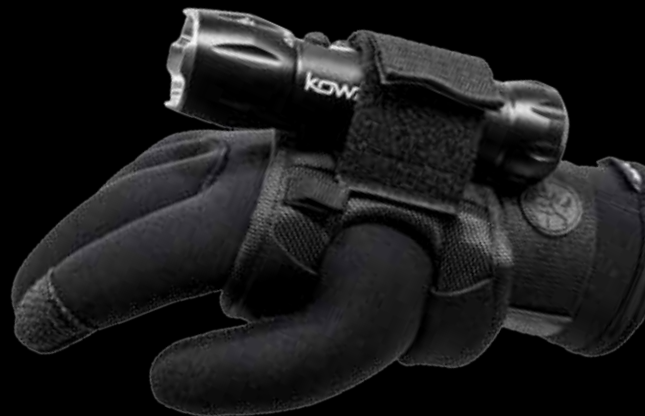
WRIST STRAP K7010007001