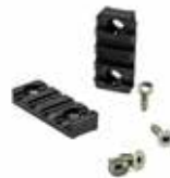
< CAM FRAME K701001901