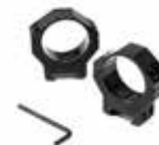
< TORCH MOUNT K7010018001