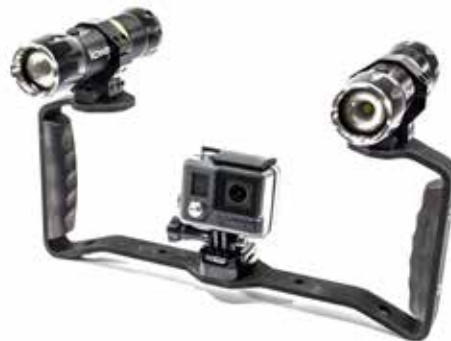
WEAVER MOUNT > K7010016001